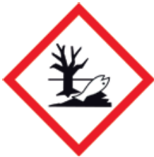
Gewässergefährdend Dangereux pour le milieu aquatique