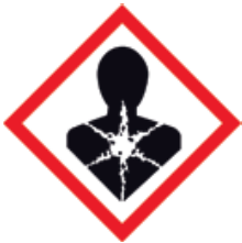
Gesundheitsschädigend Dangereux pour la santé