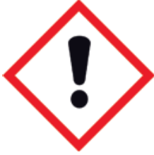
Vorsicht gefährlich Attention dangereux