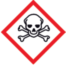
Hochgiftig Très toxique